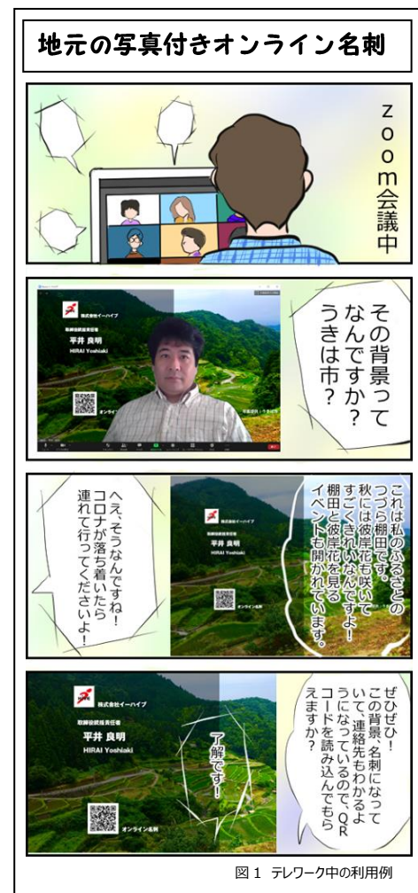
図1 テレワーク中の利用例

新型コロナを受け、仕事もテレワークが中心になりました。都心部から地方に戻り作業している人もいます。また、地方出身で地元を離れて働いている人もいます。バーチャル背景に地元の風景の画像を入れることができれば、自分の地元を自慢できたり、応援できたりするでしょう。そこで、各地方自治体協力のもと背景画像を無償で提供していただいています。