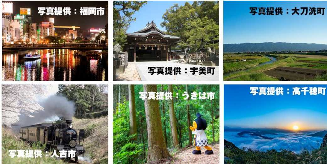
図2. 現在参加の自治体