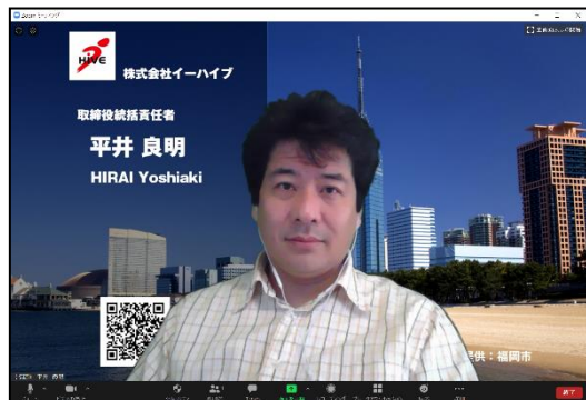
図3. ビデオ会議中の画像