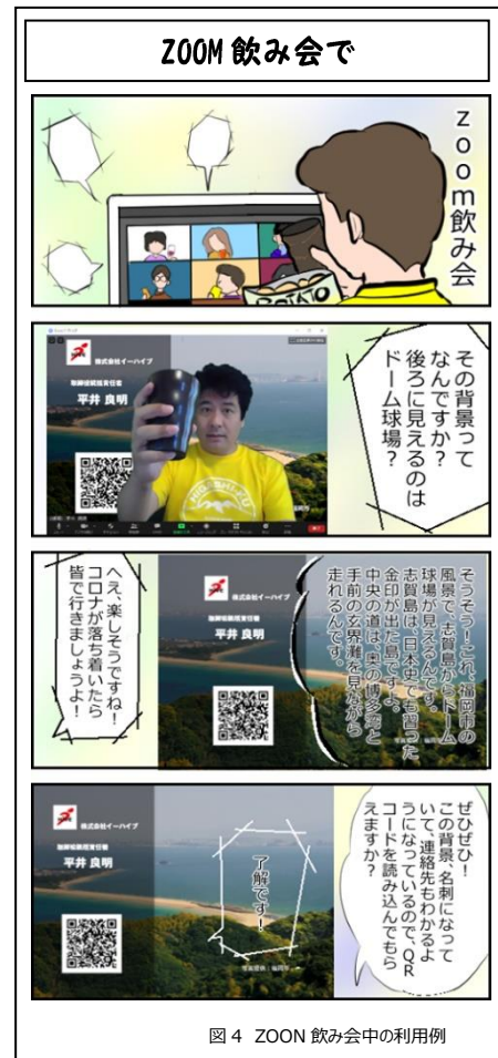
図4. ZOOM 飲み会中の利用例